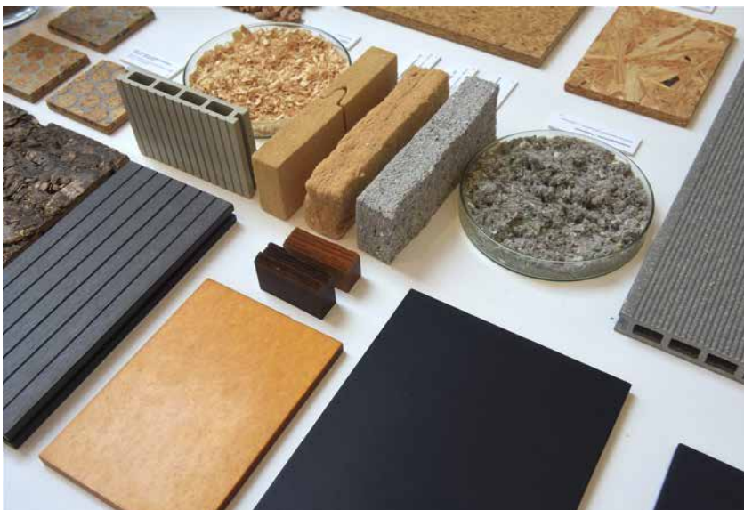
Nya material skapade av gamla produkter.

● Thorsten Klint, bosatt i Älmhultstrakten, är zoolog med fotografi som uttrycksmedel. Under sommaren visas hans bilder på Kulturhuset Blohmé i Älmhult. Utställningen Naturfotografi pågår till 18 augusti.