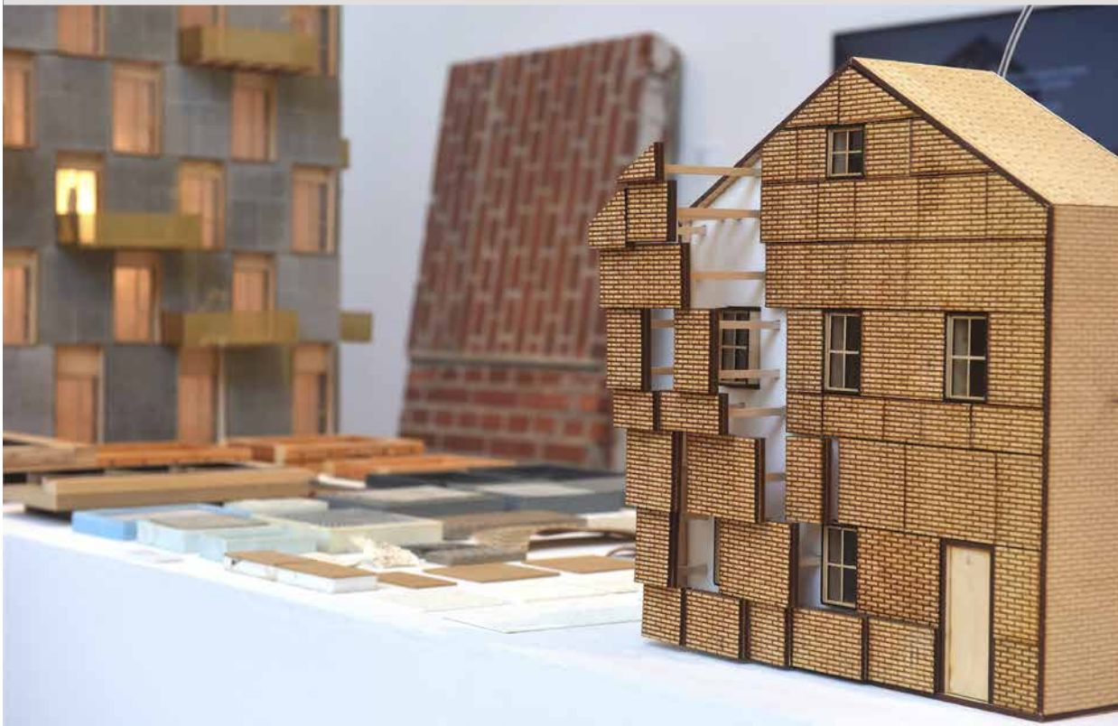
Bitar av gamla tegelfasader kan pusslas ihop till nya.