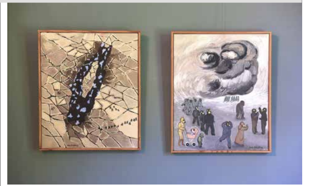
Vattnet slut och Luften slut, målningar av Sven Ljungberg.